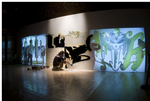
Tracciando nuove rotte per le collaborazioni artistiche in streaming (immagine di repertorio, fonte Create-net)

Lo scopo generale del progetto è dimostrare che grazie alle moderne infrastrutture di connessione è possibile abilitare un insieme di servizi innovativi, in particolare nel settore creativo inteso nel senso più ampio: dai media all'arte, dalla cultura allo sviluppo del software. Molto spesso quando si parla di banda larga ci si sofferma solo sui suoi possibili utilizzi in determinati ambiti professionali. Noi ci chiediamo: può servire a qualcos'altro, a immaginare